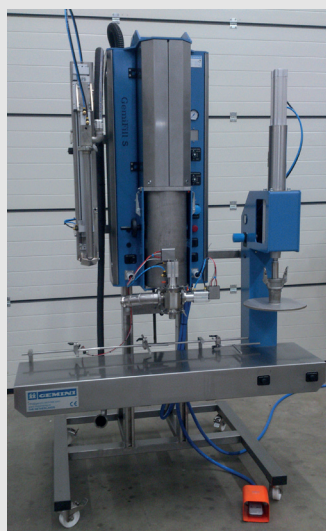
GemiFill S mit Unterspiegel-Abfülllanze und Lappendeckelschließer.