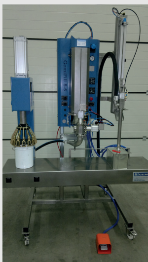
GemiFill S mit Unterspiegel-Abfülllanze und Deckeldrucker.